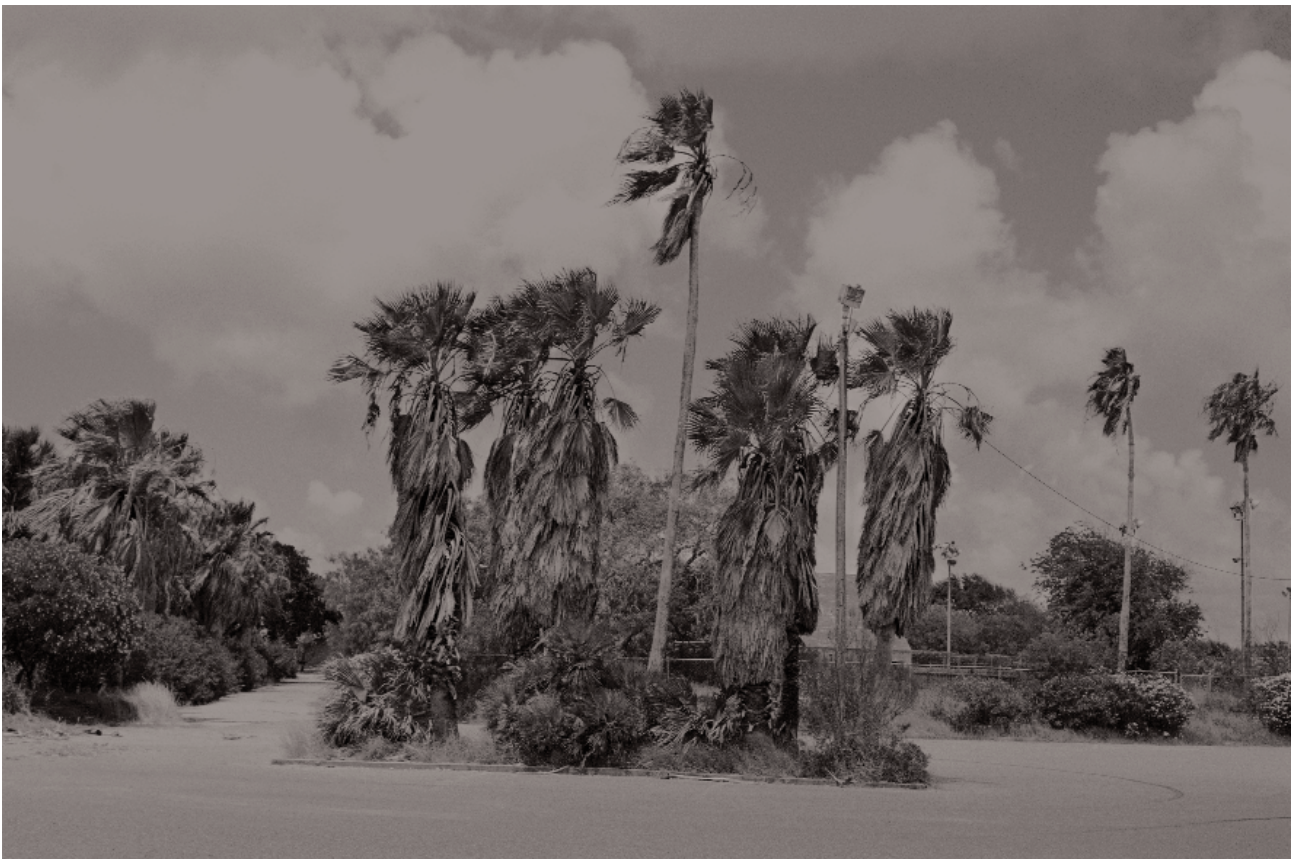
En haut : Sans titre, Standards&Poors , 2014. 30 x 45 cm. Ci-dessus : Palm Trees, The Park , 2012. 100 x 150 cm